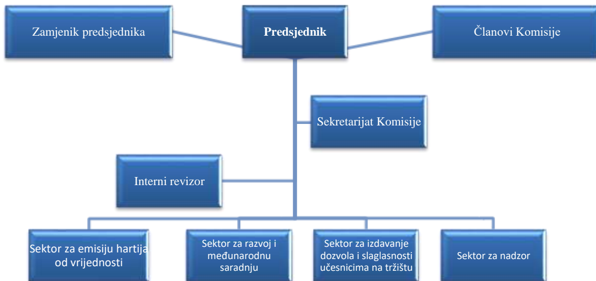
Slika 1. Organizaciona struktura Komisije

Sa stanovišta organizacione strukture, Komisiju čine četiri sektora i Sekretarijat.