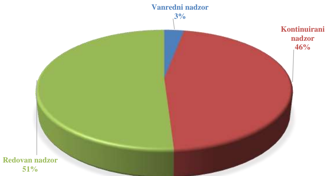
Slika 3. Nadzorne aktivnosti prema vrsti nadzora u 2022. godini

Prema vrsti nadzora, u toku 2022. godine vođeno je sedamnaest kontinuiranih nadzora, devetnaest redovnih nadzora i jedan vanredni nadzor.